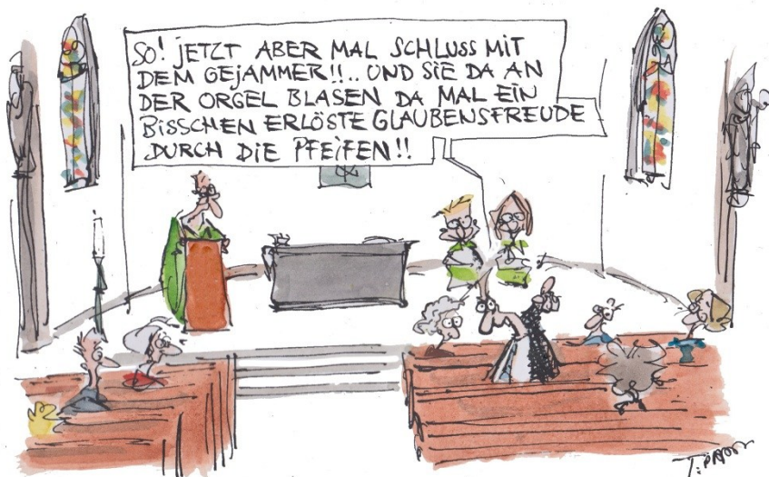
NEULICH IN ST. AGNES