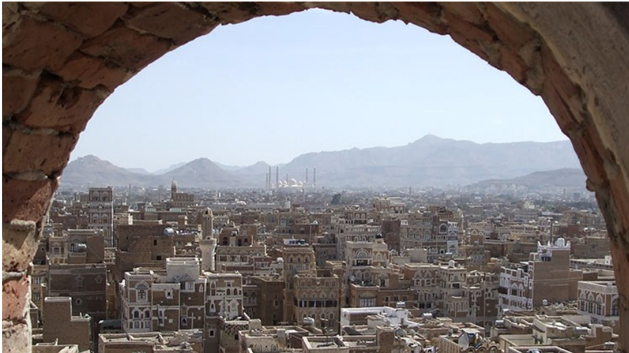
Blick über die jemenitische Hauptstadt Sanaa