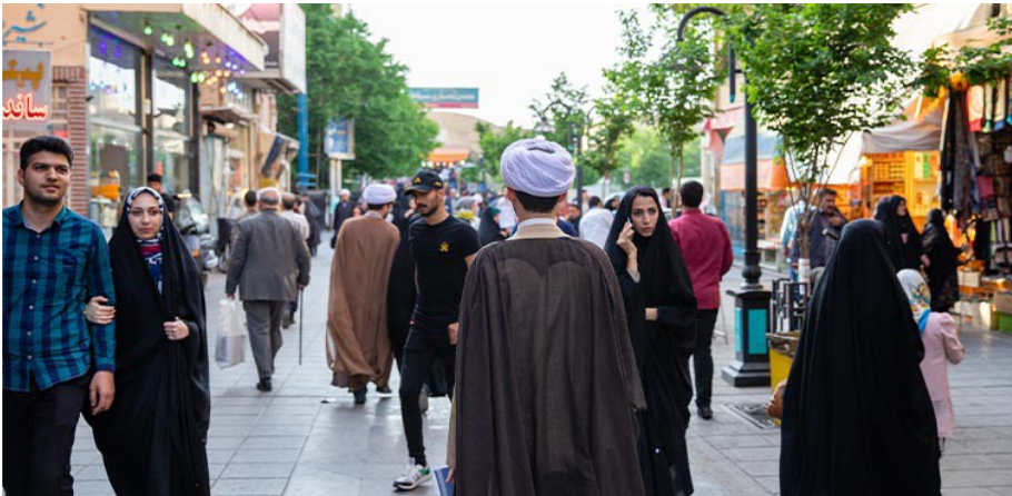
Straßenszene aus dem schiitischen Wallfahrtsort Ghom (Symbolbild)