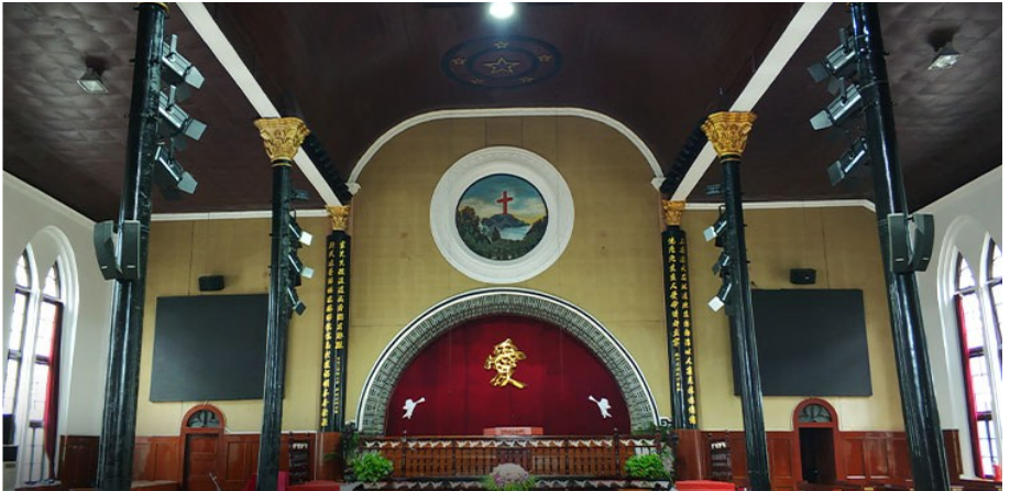
Zahlreiche Kameras in den Kirchen helfen den Behörden bei der Überwachung der Christen (Symbolbild)