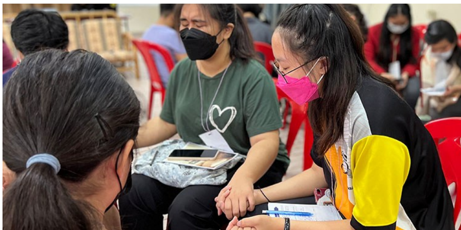
Alle kirchlichen Aktivitäten in Brunei werden überwacht (Symbolbild)